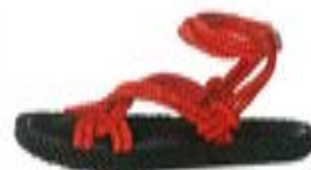
ロープストラップの サンダル ヒール 2.5cm ¥66,000 / ISABEL MARANT (イザベル マラン)