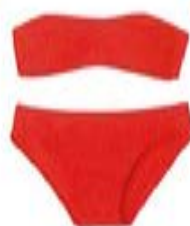
赤のバンドゥビキニ トップ ¥10,000 ボトム ¥10,000 / と もに BODAS (ギャルリー・ヴィー 丸の内店)