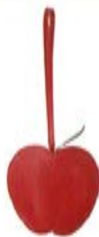
リンゴモチーフのバッグ 「ボム」 本体 ¥17,000 ¥375,000 / HERMES (エルメスジャポン)