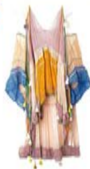
マルチカラーのチュニック ¥1,278,000 / CHLOE (クロエ カス タマーリレーションズ)